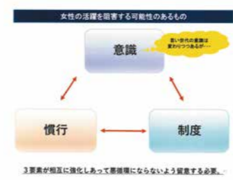
※講演会スライドより

OECD加盟国で、15歳時点の数学や科学の学力を数年毎に比較しており、日本は男女ともOECD加盟国第一位です。長年、トップクラスでばらつきも小さい。でも残念ながら、理数系の大卒・院卒の女性割合はOECD加盟国で最低です。諸外国ではキュリー夫人をはじめ多くの女性がノーベル賞を受賞していますが、科学や数学の学力が世界一の日本の女性では一人もいません。日本の女性が高い潜在力を活かし切れていないのです。この潜在力を活かすには、教育や労働、組織マネジメントにおける制度、慣習、意識など様々な側面で取り組みが必要だと思います。 3つ目は、男女間の賃金格差です。日本の賃金は、正社員50代後半のピークで、男性は月額43万円、女性31万円です。非正規男性と非正規女性の間も賃金の差があります。学歴別にみると、大卒正社員のピークは、男性52万円、女性40万円。大卒正社員女性と高卒正社員男性の賃金カーブはほぼ同じ傾きで、大卒正社員男性との間で年々給与の格差が広がる形です。厚労省のデータで同じ職種の賃金を見ると、保育士で30代後半、勤続年数も労働時間も男女とも同程度で年収は男性44.9万円、女性39.3万円。会計事務職についても、同様の勤続年数、労働時間で、42歳男性