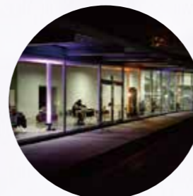
【鶴岡市】 荘銀タクト鶴岡