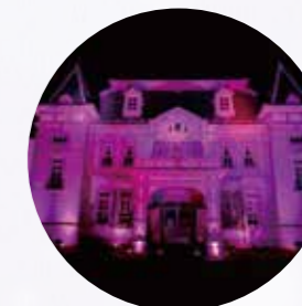
【米沢市】 旧米沢高等工業学校本館