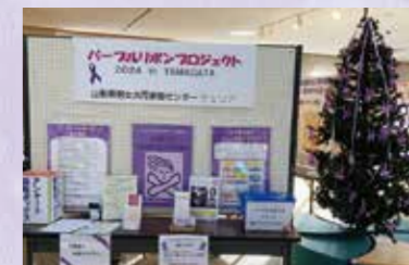
●遊学館2階ギャラリー

遊学館ギャラリーにおいてDVをテーマにしたパネルの展示とパープルリボンやリーフレットの配布を行いました。