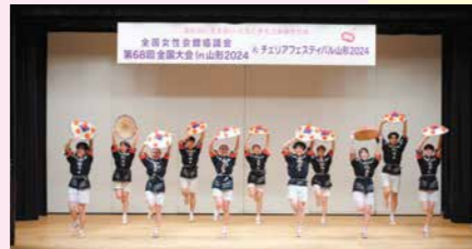
「山形大学 花笠サークル 四面楚歌」による花笠踊り