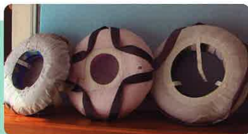
廃棄されるエアバッグ、シートベルトを 使用した救命浮き輪