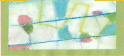
◎オイルパステルで色を重ねていきます！