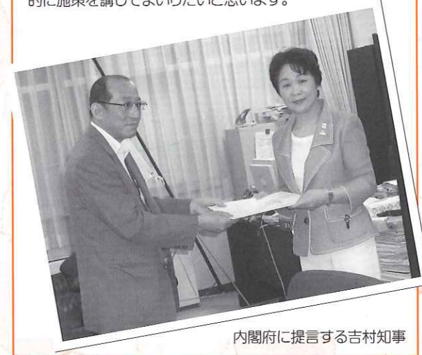
内閣府に提言する吉村知事

この目標達成に向け、各種の施策を、強力で進めていただくよう政府に要請するとともに、山形県としても積極的に施策を講じてまいりたいと思います。