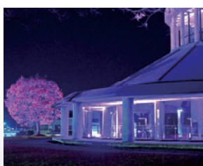
高島町 高島町文化ホール「まほら」