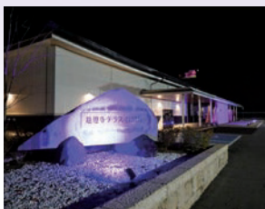
寒河江市 慈恩寺テラス