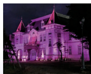
米沢市 旧米沢高等工業学校本館