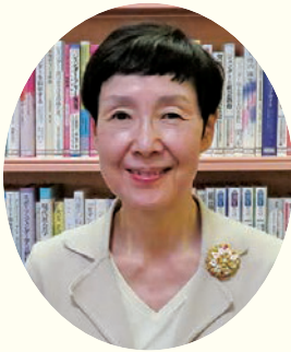
2021年4月からチェリア館長、東北公益文科大学名誉教授

月経、避妊、妊娠、出産、更年期等、だれもが直面する場面で、正しい知識を得て、自分で考え決定していくことができるようになるということ。避妊法の選択肢の乏しき、WHOが勧めない人口妊娠中絶法、妊娠出産の経済的・心理的負担の大きさ等々、残念ながら日本の社会は多くの課題を抱えています。先進国で達成されている水準から大きく遅れをとっているのです。男性も女性もだれもが関心を寄せ、学び合い、だれもがすべて満たされて（ウェルビーイング）生きることができると社会にしていきたいと思えます。