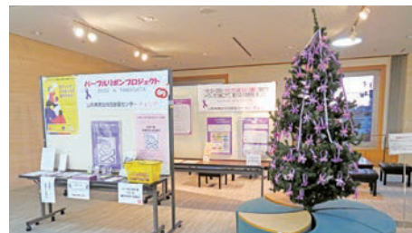
● 遊学館2階ギャラリー

DV防止をテーマとしたパネルの展示とパープルリボンやリーフレットの配布を行いました。ツリーは、来場された方から飾っていただいたたくさんのパープルリボンのオーナメントでプロジェクトを象徴する姿となりました。