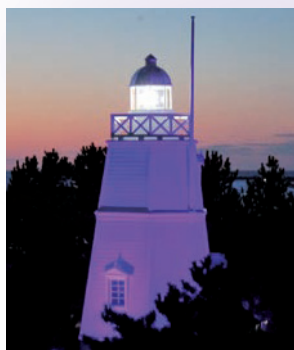
酒田市 日和山公園六角灯台