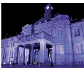
山形市 郷土館「文翔館」