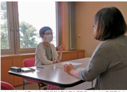
インタビューを行ったのは遊学館2階の団体活動室。チエリア登録団体であれば利用可能なスペース。

チエリアでは男女共同参画への理解を深めるための学習機材を用意しています。詳しくはHPをご覧ください。