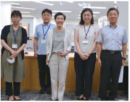
チエリアの活動を支えるスタッフ

※3 厚生労働省：「平成28年度人口動態統計特殊報告」「婚姻に関する統計」の概況