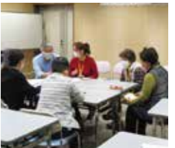
“次”につなげるために、何をしたいかを話し合う受講者たち。

反省点：フォーラム内の時間配分、同じ環境下でのリハーサルをすべきだった また、今回の聞き取り調査をした事例を改