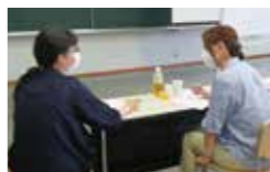
受講生が相手役に対して、コロナ禍での気づきなど質問して聞き取り調査の練習をしました。

自主企画講座について「コロナ禍の自粛生活の中でどう過したか、感じ、気がついたものは何かを聞き取り調査し、発表する旨が講師より提案。受講生と事務局が「対一」になり、聞き取り調査の練習を行ったあとに、自主企画講座に向けて具体的な日時や内容、聞き取り調査の仕方などを話し合いました。