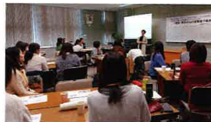
山形ママコミュニティ mama*jam https://mama-jam.com/

今はとても便利な時代です。スマートフォンやパソコンなどを使って、いつでもどこでも、繋がっていきましょう。皆さんのご参加お待ちしております。