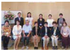
フォーラムで発表した受講生グループ「2020置賜チエリア」メンバーと講師や事務局。

38名の来場者を前に、受講生5名が身近な友人や知人5名に聞き取り調査をした結果を、プロジェクトを使用し発表していきまし。これまで経験したことのない自粛生活の中で生じたリアルな女性たちの声を受け、来場者から質問も飛び出し、発表者との意見交換がなされます。