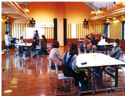
チェリア塾基本コースin最上の様子 年齢も職業も異なる塾生たちが、共感しあい刺激しあいながら学びます。

性別や年齢によって、役割が固定されたりあきらめたり、「なぜ？」「どうして？」とモヤモヤした経験はありませんか？ 身近なところに存在しているジェンダー問題に気づき、男女共同参画の考え方を学び身に付けることで、これまで見えてこなかった視点が広がっていきます。