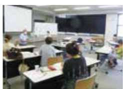
具体的な聞き取りのコツを学ぶため、講師が受講生にインタビュー。

受講生1人につき5人の友人や知人に聞き取り調査を行うにあたり、やってみたいの感想や進捗の報告からスタート。従来の実践コースでは、事業計画案やグループ名、チラシ作成などは自ら立案・企画します。今回は、聞き取り調査と自分たちの発表に重きを置いてほしいという講師の考えから、具体的な聞き取り調査の解説を受け、学びを深めました。