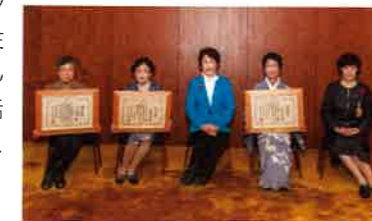
県知事と受賞者のみなさん

村山市連合婦人会長、市で初の女性市民センター長等を務め、女性リーダーとして活躍。現在は、市老人クラブ連合会副会長兼女性部長として、高齢者組織での女性の地位向上に向けて活動するなど、男女共同参画社会づくりに大きく貢献している。