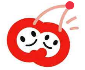
山形県男女共同参画センターの愛称「チェリア」のマーク