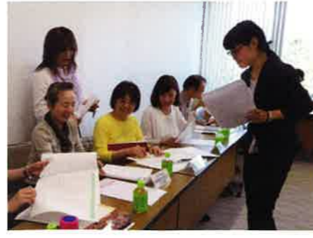
毎年秋に開催されるチェリアフェスティバルでは、登録団体の代表が集まり幾度も会議を重ねてイベントを創り上げています。