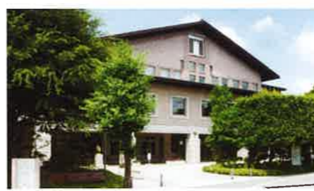
チェリアがある遊学館外観

共に参画する豊かな社会のこと。男性・女性問わず「やりたい」気持ちに応じてあらゆる分野で活動できるよう、様々な支援をする場です。チェリアでは今日も、事務室で夢の実現に向けて活動するグループの登録や活動室の予約を受け付けていたり、キッズコーナー併設のフリースペースでDVD関連の書籍を読むママ達がいったり、また講座を受講するために学習室に足を運ぶ人達の姿も…。ほぼ無料でどなたでも利用できるので、気軽に訪れてみてください。