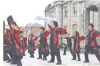
東根市のよさこいパフォーマンス集団「チーム楽」の迫力ある演舞や、山形大学アカペラサークルのうっとりする歌声が会場を盛り上げました。