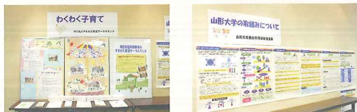
日頃の活動内容紹介や、子育て、男女共同参画に関する情報を展示しました。