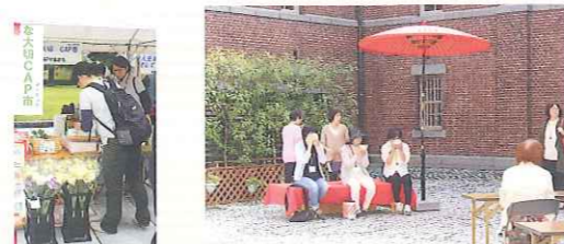
お茶席やマーケット等、多くの方から来ていただきました。