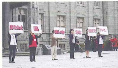
文翔館前庭での実行委員によるタイトルコール。いよいよチェリアフェスティバルが始まります！