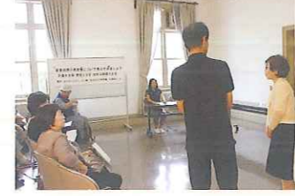
寸劇や性格判断、セミナーなど、多彩なワークショップが開催されました。