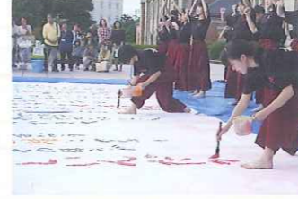
県立山形高等学校書道部による、「書道パフォーマンス」。見るものを圧倒しました。