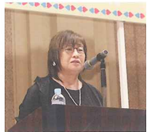
ノンフィクション作家 吉永みち子 氏

チェリアフェスティバル注目の記念講演会は、ノンフィクション作家であり、テレビ朝日系列の情報番組コメントーターとしてもおなじみの吉永みち子さんが講師。会場の文翔館議事場ホールは、ときおりユーモアを交えながら、聴く人皆を惹き込むトークに満員のお客さんの熱気に包まれました。