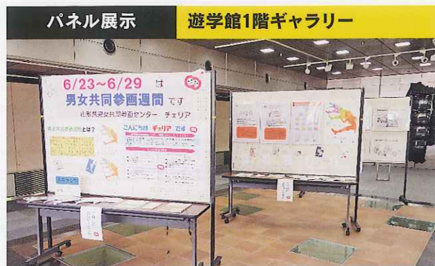
パネル展示 遊学館1階ギャラリー

県民の皆様に男女共同参画週間について理解を深めていただくため、パネル展示とラジオキャンペーンを行いました。