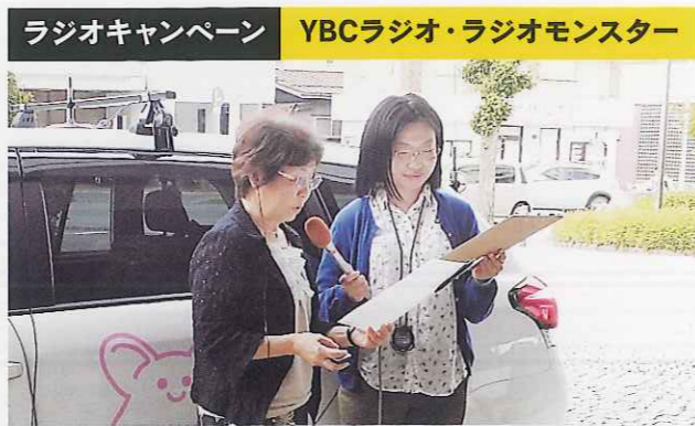
ラジオキャンペーン YBCラジオ・ラジオモンスター

パネル展示には、多くの方が見に来てくださいました。「なるほどジェンダー（子育て支援）」というパネルは、イラストで解説されているので、分かりやすいと好評でした。