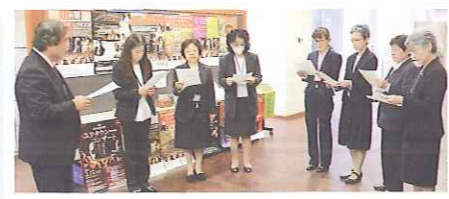
山響定期演奏会でのスタッフ説明