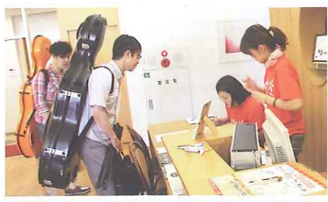
アフィニス夏の音楽祭のプレイベントでの受付

Mプロジェクト（NPO法人 山形の音楽活動を応援する会・Mプロジェクト）は、演奏会・発表会の企画や支援を通じて、山形における音楽文化の更なる発展の力になろうと考え、2008年8月に設立されたボランティア団体です。