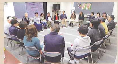
全員での話し合いの様子

今回の貴重な体験を糧に、より成熟した男女共同参画社会の実現を目指し、紅山々の活動を推進していきたいと思っております。