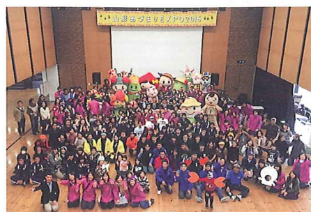
今年度開催イベントにて

また、このイベントで得た知識を生かして、置賜・村山・最上・庄内の県内4地区で各地区に住む実行委員を中心に、それぞれの地区で活躍している方から活動内容や活動に至る想いを学ぶ講演会も開催しました。地元の高中生や大学生などと一緒に学んだことや講演会の開催を重ねたことにより年齢関係なく交流を深めることができ、地域と学生、そして若者を繋ぎきっかけをつくれたのではないかと思います。これからも私たちは「山形が大好き!」「山形を盛り上げたい!」という想いのもと、山形の“今”を最大限に伝えていけるような活動を展開していきたいと思えます。