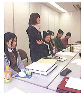
自分たちで運営するための会議

私たち山形あつまりEXPO実行委員会は、地域活性化のための担い手づくり、山形の魅力再発見を主な目的として県内の大学生や20代の若者を中心に活動しています。